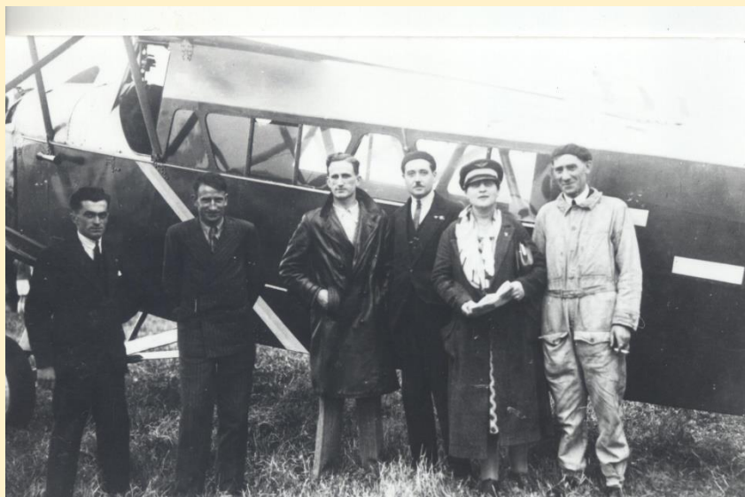
Equipage des Ailes Lyonnaises à l'arrivée du Rallye d'Auvergne à Clermont-Ferrand le 9 juillet 1934