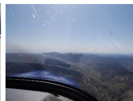
Le ballon D'Alsace