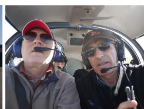
Changement de pilote