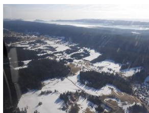
Le neige du jura