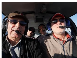
l'équipage du F-GYPG