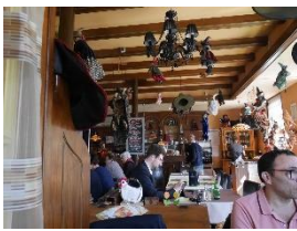
Le repère des sorcières